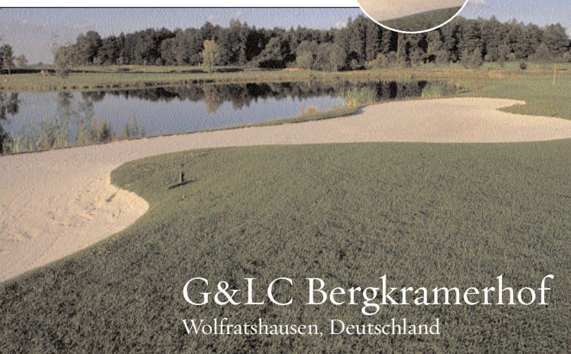
G&LC Bergkramerhof Wolfratshausen, Deutschland