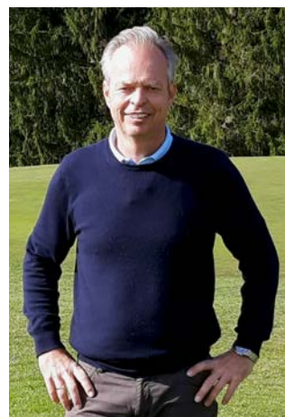
Thomas C. Himmel Himmel Golf Design

Flächenreduzierung lautet auch einer der Lösungsansätze beim intelligenten Wassermanagement, das sich aus mehreren Faktoren zusammensetzt. Nach einer genauen Analyse der örtlichen Gegebenheiten und der zu erwartenden Niederschlagssituation in der Zukunft, ergänzt durch die zu erwartende strengere Regulierung von Grundwasser und einem Abrücken von der Verwendung von Trinkwasser zur Bereg-