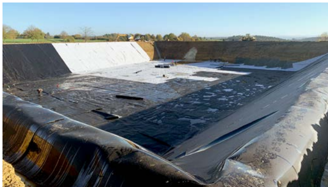
Rein technisch gestalteter Speicherteich außerhalb von Spielflächen