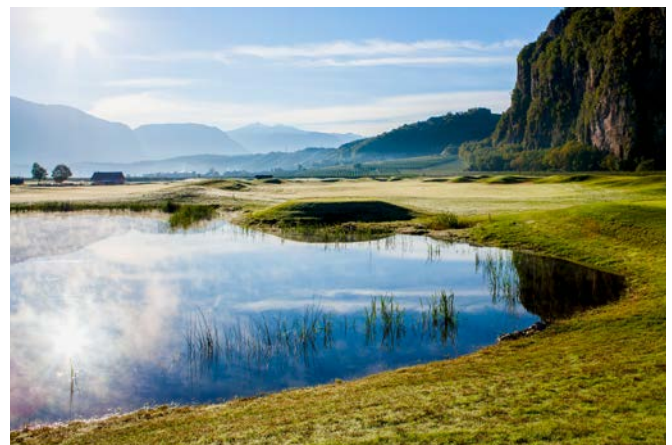
Zahlreiche Hochwasser-Retentionsteiche in Eppan

Gerade beim Thema Starkregen und Überflutung wird auch die Bunkerkonzeption von Golfanlagen immer mehr zum Thema. Die Gestaltung von Bunkern ist ebenso wie deren Größe und Anzahl für zukunftsfähige Plätze besonders re-