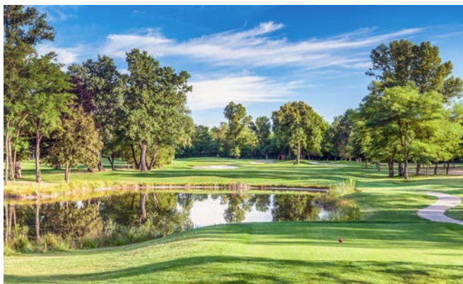
In das Golfspiel eingebundener Speicherteich