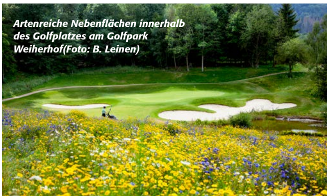
Artenreiche Nebenflächen innerhalb des Golfplatzes am Golfpark Weiherhof