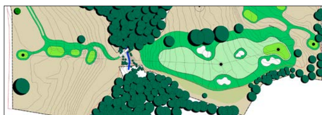
Golfplatz neu mit weniger Mähflächen und weniger – aber dafür interessanter positionierten – Bunken (Abbildungen: T.C. Himmel)