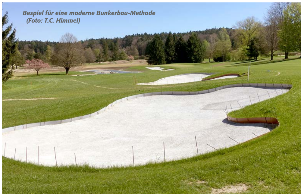
Beispiel für eine moderne Bunkerbau-Methode

levant. Die Investition in moderne Unterbau- und Abdichtungsschichten von Bunkern, sei es über Geovliese, Drän-Beton, Kunststoffgranulate etc., ist zwar kostenintensiv, erleichtert aber gerade in Gebieten, die vermehrt von besonders starken Unwettern betroffen sind, die Beispielbarkeit und verhindert größere Erosionsschäden. Die Langlebigkeit und die Reduktion von Personaleinsatz gehen damit einher.