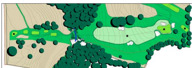
Golfplatzbestand mit großen gemähten Nebenflächen.

In den meisten Teilen Deutschlands bietet sich die Anlage von Zwischen- oder Notspeichern an, in denen größere Mengen Wasser für Dürrephasen bevorratet werden. Speicherteiche von