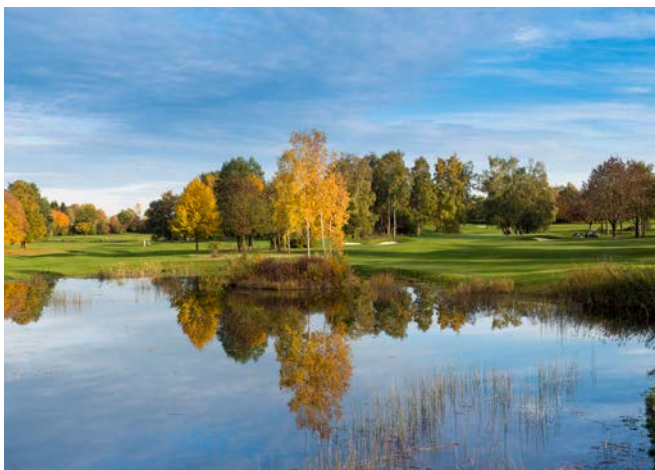
Hochwasser-Retention am Golfclub Olching

mehr als 100.000 m 3 Wasser werden inzwischen in Kontinentaleuropa gebaut. In Deutschland sind Golfanlagen mit einem oder mehreren Speichern von rund 50.000 m 3 meist gut aufgestellt. Diese können sowohl als optisch weniger attraktive technische Speicher außerhalb der klassischen Spielfläche so angelegt werden, dass sie aufgrund großer Tiefe wenig Verdunstungsfläche haben, andererseits aber auch als ins Spiel integrierte Speicherflächen gestaltet werden.